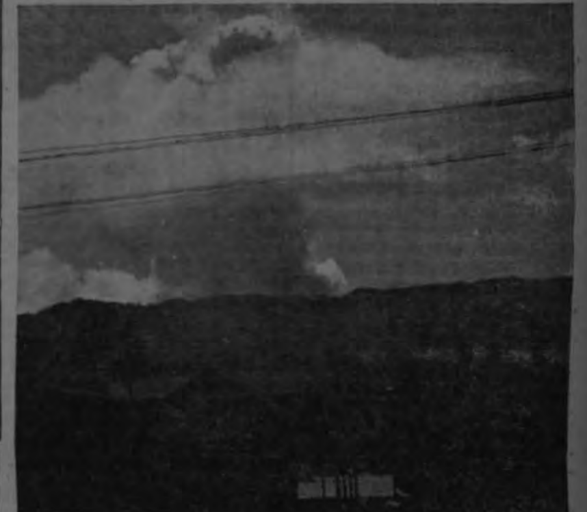
La población de aquella ciudad contempló ayer, durante tres horas consecutivas, una formidable erupción que se teme haya sido producida por el Volcán Santa Lucia.

El fenómeno produjo una temperatura extraordinariamente cálida en Cartago y pueblos vecinos.