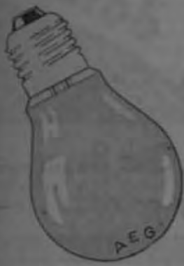
Bombillas de Fama mundial